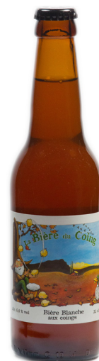
Blanche aux Coings