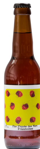
Berliner Weisse Framboise