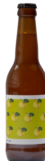
Berliner Weisse aux coings